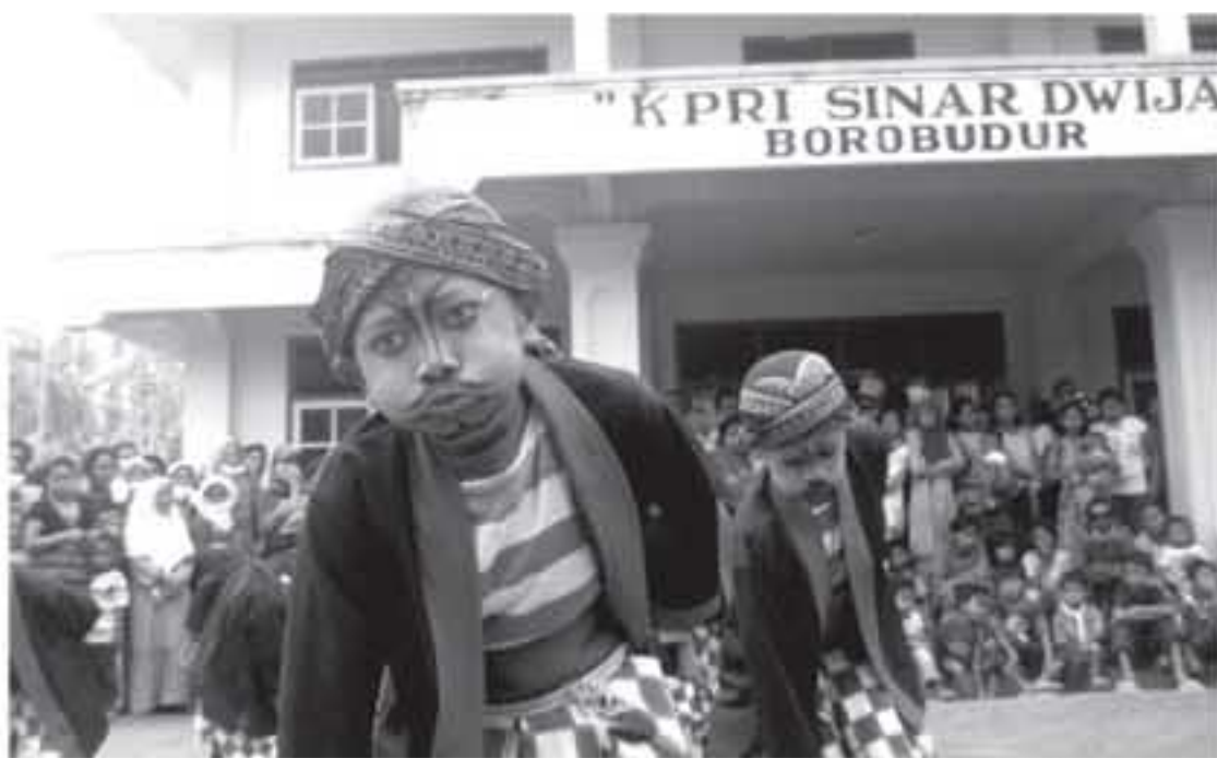
HIBUR PENGUNGSIS: Anak-anak kelompok Geculan Bocah asal Dusun Gejayan Banyusidi Pakis menghibur pengungsi bencana Merapi di Gedung KPRI Borobudur, Minggu (7/11).

Oleh Nina Atmasari WARTAWAN HARIAN JOGJA