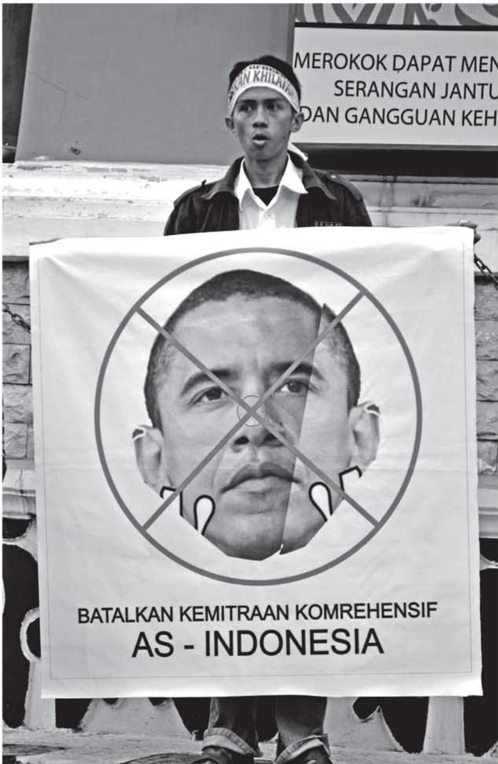
TOLAK OBAMA: Seorang pengunjung rasa dari Hizbut Tahrir Sulawesi Tengah memegang spanduk bergambar Presiden AS Barack Obama saat berunjukrasa di Bundaran Hasanuddin Palu, Sulawesi Tengah, Minggu (7/11). Hizbut Tahrir menolak kedatangan Presiden AS Barack Obama yang dijadwalkan akan melakukan kunjungan ke Indonesia pada 9 November mendatang.