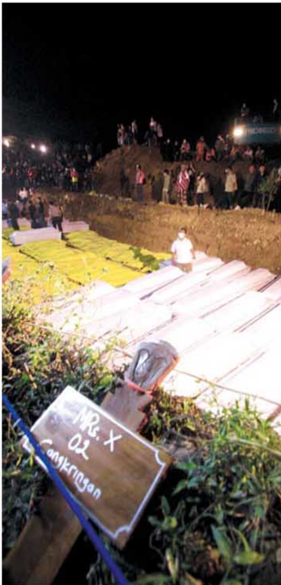
PEMAKAMAN: Suasana pemakaman masal korban awan panas Gunung Merapi yang terjadi pada Jumat (5/11) lalu di TPU Desa Margodadi, Seyegan, Sleman, Minggu (7/11).