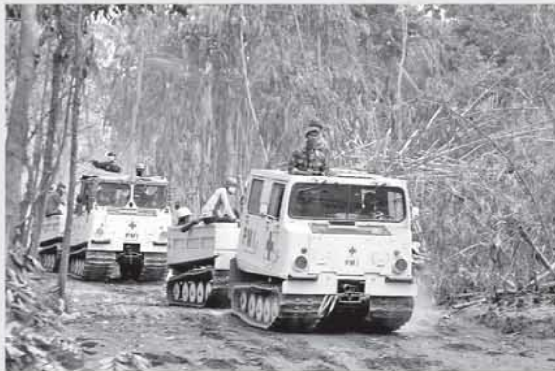
EVAKUASI KORBAN: Dua kendaraan hagglunds milik Palang Merah Indonesia (PMI) mencari korban letusan Gunung Merapi Minggu (7/11).

Adapun di Posko Watsan PMI yang ada di PKU Muhammadiyah Jogja, Jusuf Kalla meminta tim Watsan untuk selalu