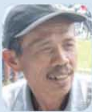
Bagiyo, Pengungsi di Barak Stadion Maguwoharjo

Tadi saya disuruh mengungsi sama pak tentara dikasih informasi kalau daerah saya tidak aman. Sampai sekarang bantuan makanan sudah cukup. Semua makanan ada, pakaian pantas pakai ada. Tapi MCK sedikit ngantre