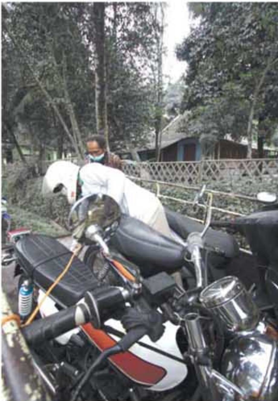
KENDARAAN: Korban letusan Gunung Merapi mengevakuasi kendaraannya di Dusun Cakran, Desa Wukirsari, Cangkringan, Minggu (7/11). Sejumlah warga mulai mengevakuasi harta benda yang bisa diselamatkan.