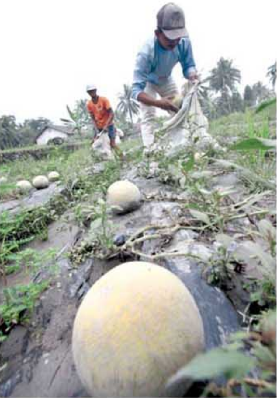
PANEN DINI: Petani terpaksa memanen buah melonnya agar tidak membusuk walaupun belum saatnya untuk dipanen karena terkena dampak abu vulkanik Gunung Merapi di Desa Wukirsari, Cangkringan, Sleman, Minggu (7/11).