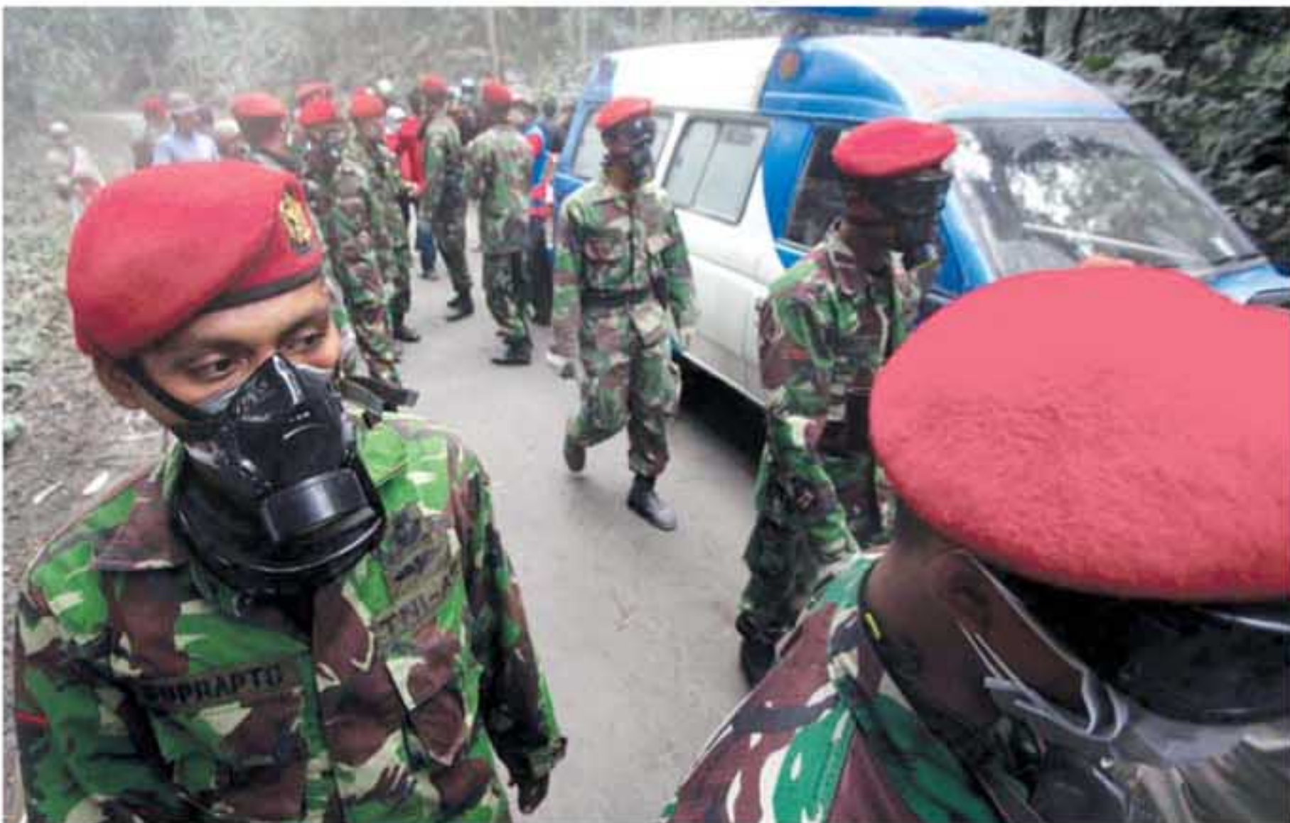
KOPASSUS BANTU EVAKUASI: Anggota Kopassus turut mengevakuasi korban letusan Gunung Merapi di Dusun Ngepringan, Desa Wukirsari, Cangkringan, Sleman, kemarin.