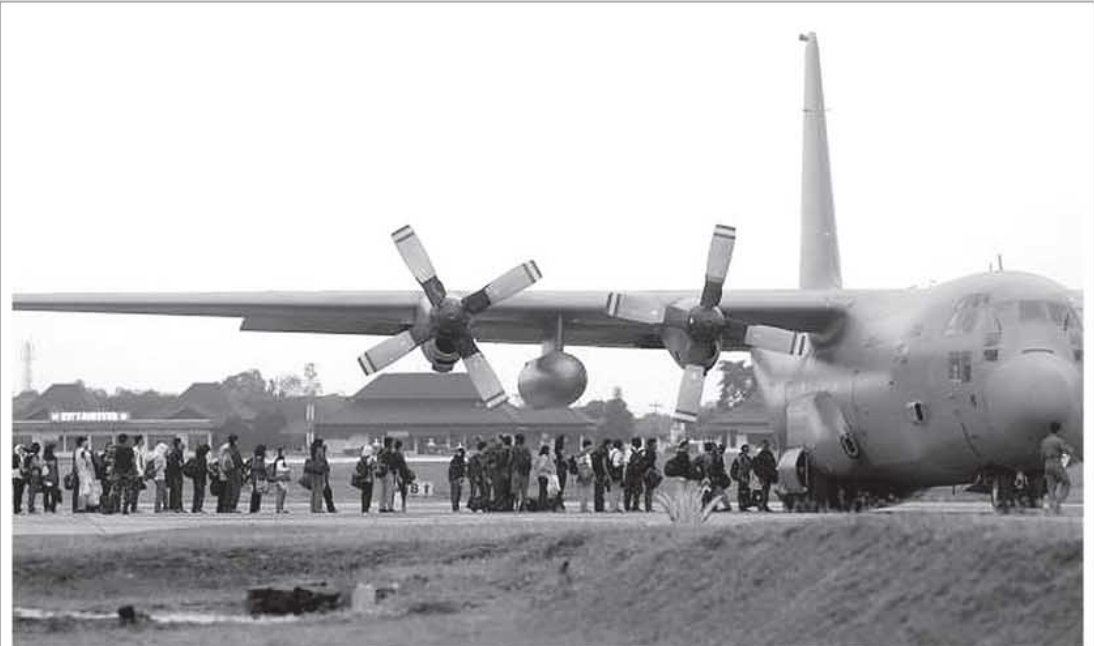
PULANG KE MALAYSIA: Mahasiswa asal Malaysia yang kuliah di Jogja antre naik pesawat terbang Royal Air Force jenis Hercules C130H di Bandara Internasional Adisumarmo, Minggu (7/11). Sebanyak 600 mahasiswa