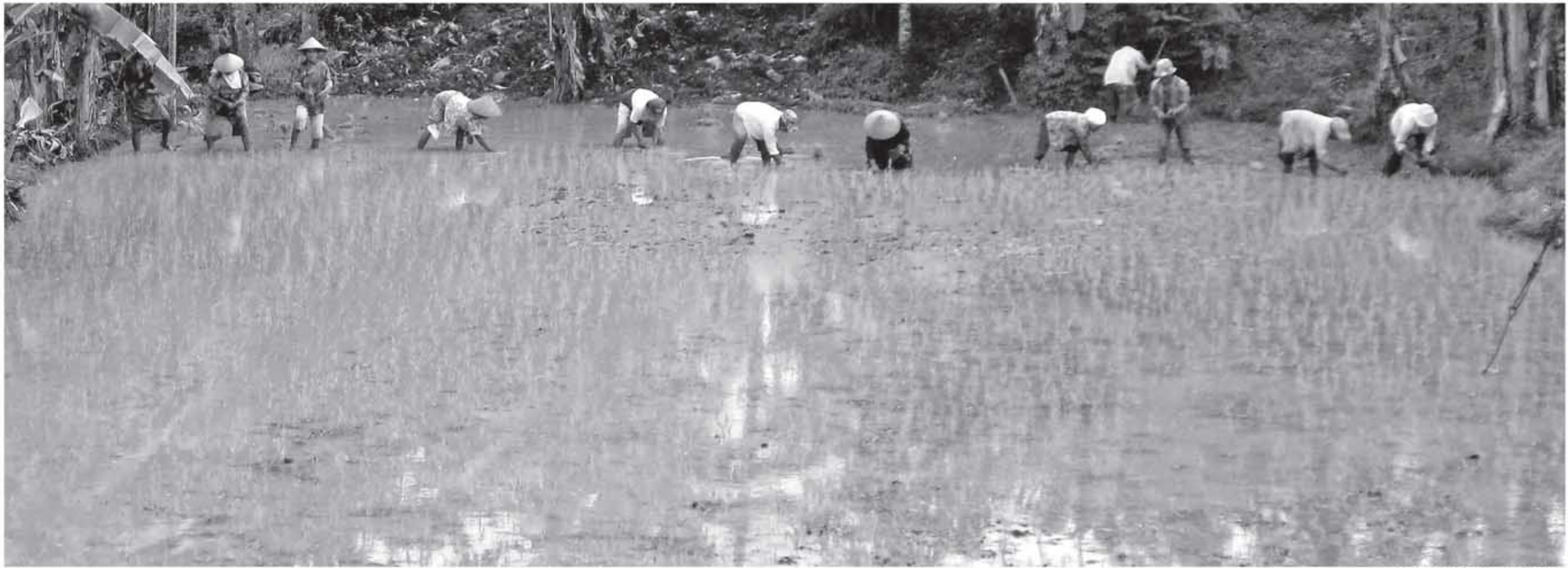
BERKAH ABU MERAPI: Petani di Desa Putat, Patuk, mulai menanam padi setelah hujan sering mengguyur wilayah itu. Abu vulkanik yang beberapa kali menghujani wilayah Gunungkidul menjadi berkah yang dipercaya bakal memberi kesuburan pada tanaman.