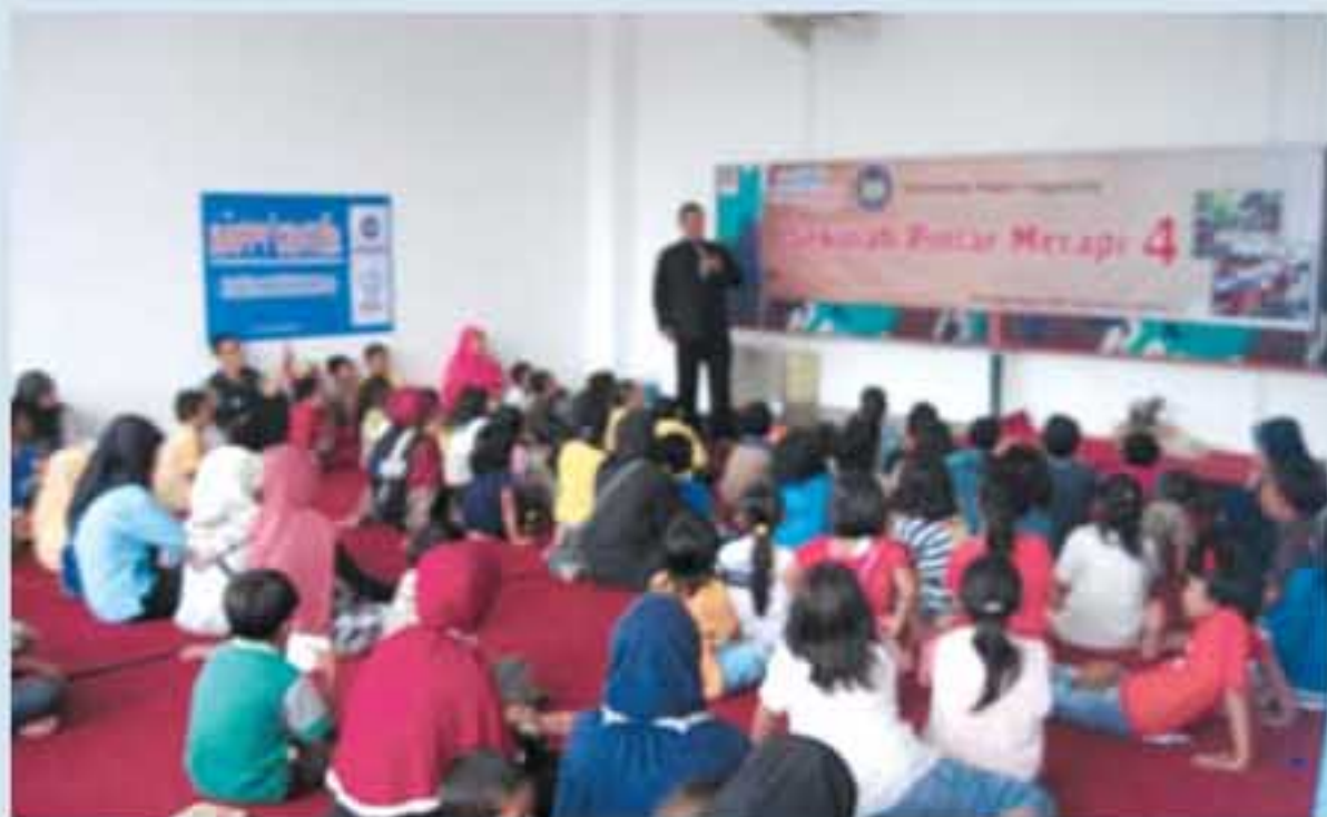
Suasana Sekolah Pintar Merapi, Minggu (7/11)

rikan sedikit pengetahuan dan pengenalan lingkungan, sehingga tidak selalu di dalam kelas saja. Misalnya jalan-jalan sekitar barak, outbond, dongeng, dan edukasi pembentukan karakter. Sedangkan sore hari diberikan kegiatan rohaniyah seperti mengaji salat berjamaah. Selebihnya kalau malam ada acara yang bersifat fun seperti nonton film. Yang terpenting semua kegiatan adalah mengupayakan update