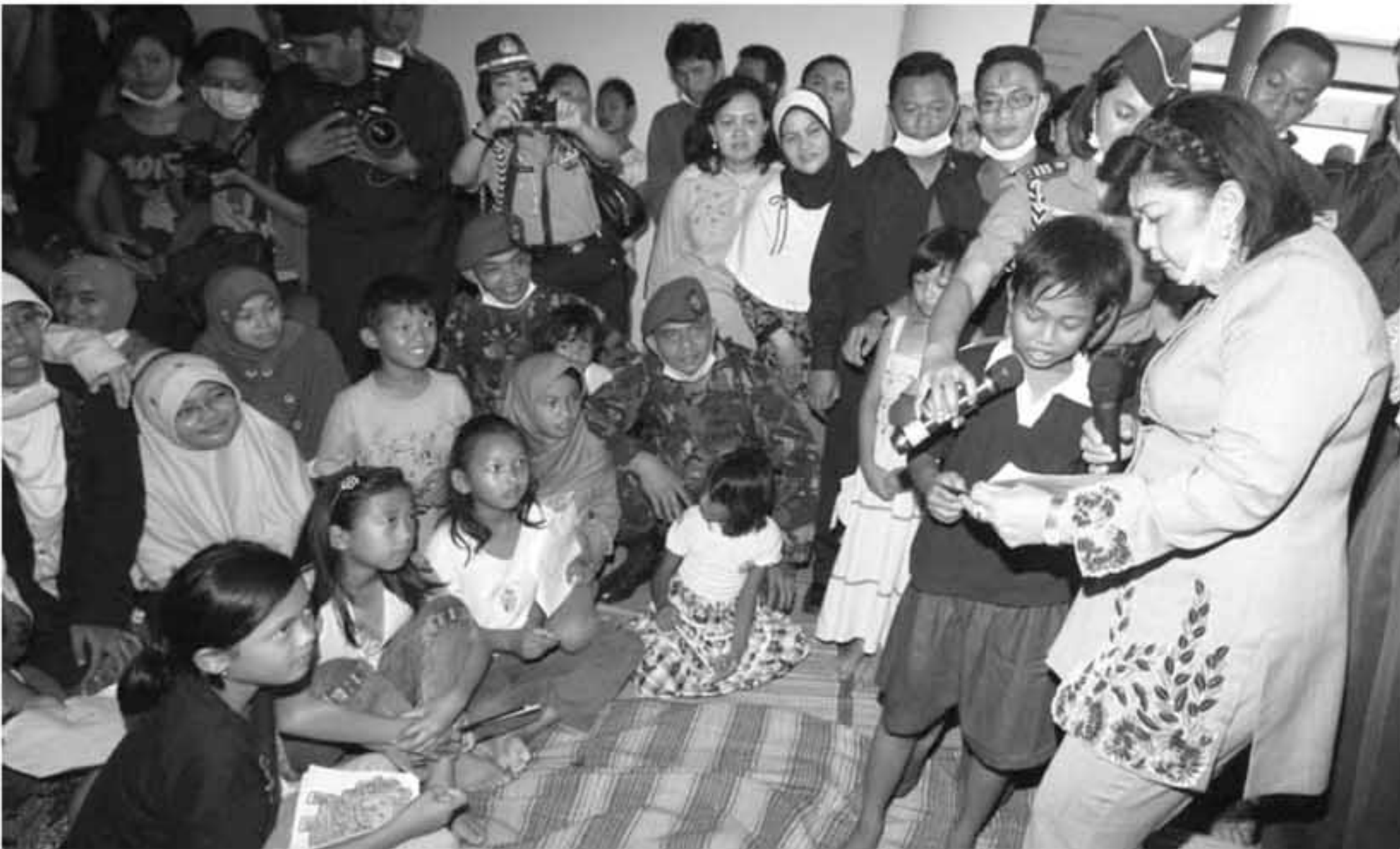
BERBAGI CERITA: Ibu Negara, Ani Yudhoyono, mendengarkan cerita seorang anak saat mengunjungi barak pengungsian Merapi di Stadion