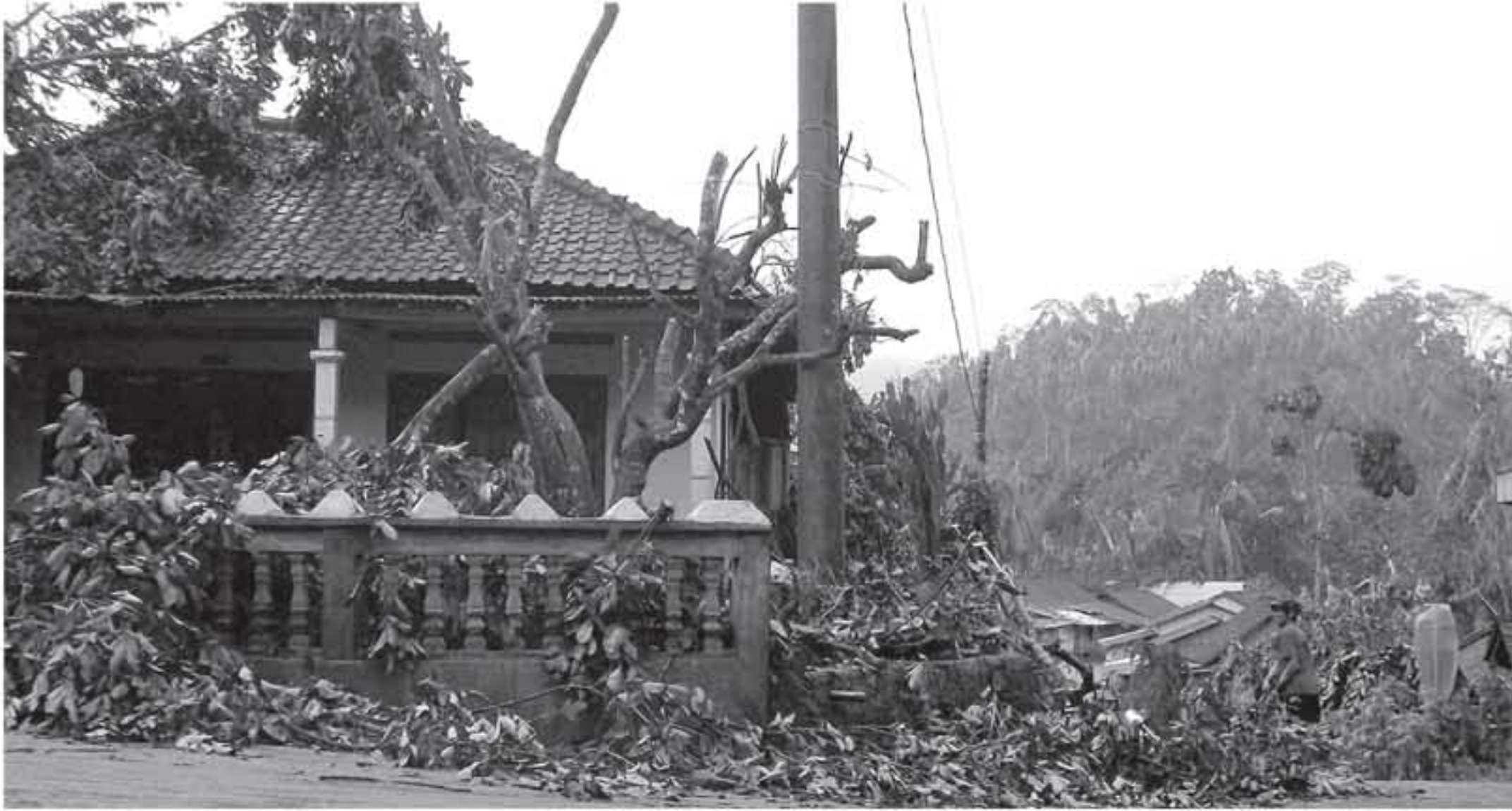
TUMBANG: Pohon tumbang di Desa Banjarjaya, Kulonprogo akibat kena abu vulkanik Merapi yang meletus pada Kamis (4/11) lalu.