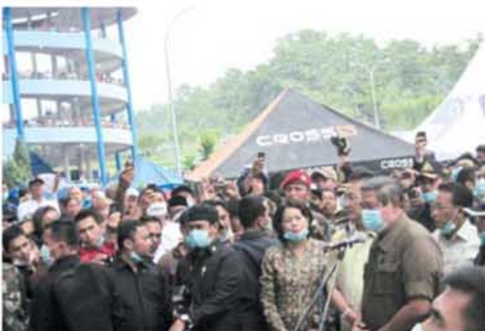
PIDATO: Presiden Susilo Bambang Yudhoyono (dua kanan) berbicara di hadapan ribuan pengungsi saat berkunjung ke Stadion Maguwoharjo, Sleman, Minggu (7/11).