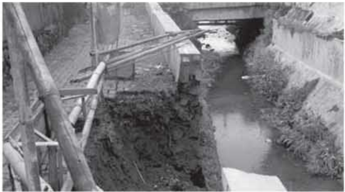
AMBROL: Warga memberi rambu dari bambu pada talud kali Jenes yang ambrol di RT 06 RW I, Dawung, Serengan, Solo, Minggu (7/11). Talud tersebut ambrol pada Sabtu (6/11) karena tak mampu menahan gerusan air hujan yang cukup deras.