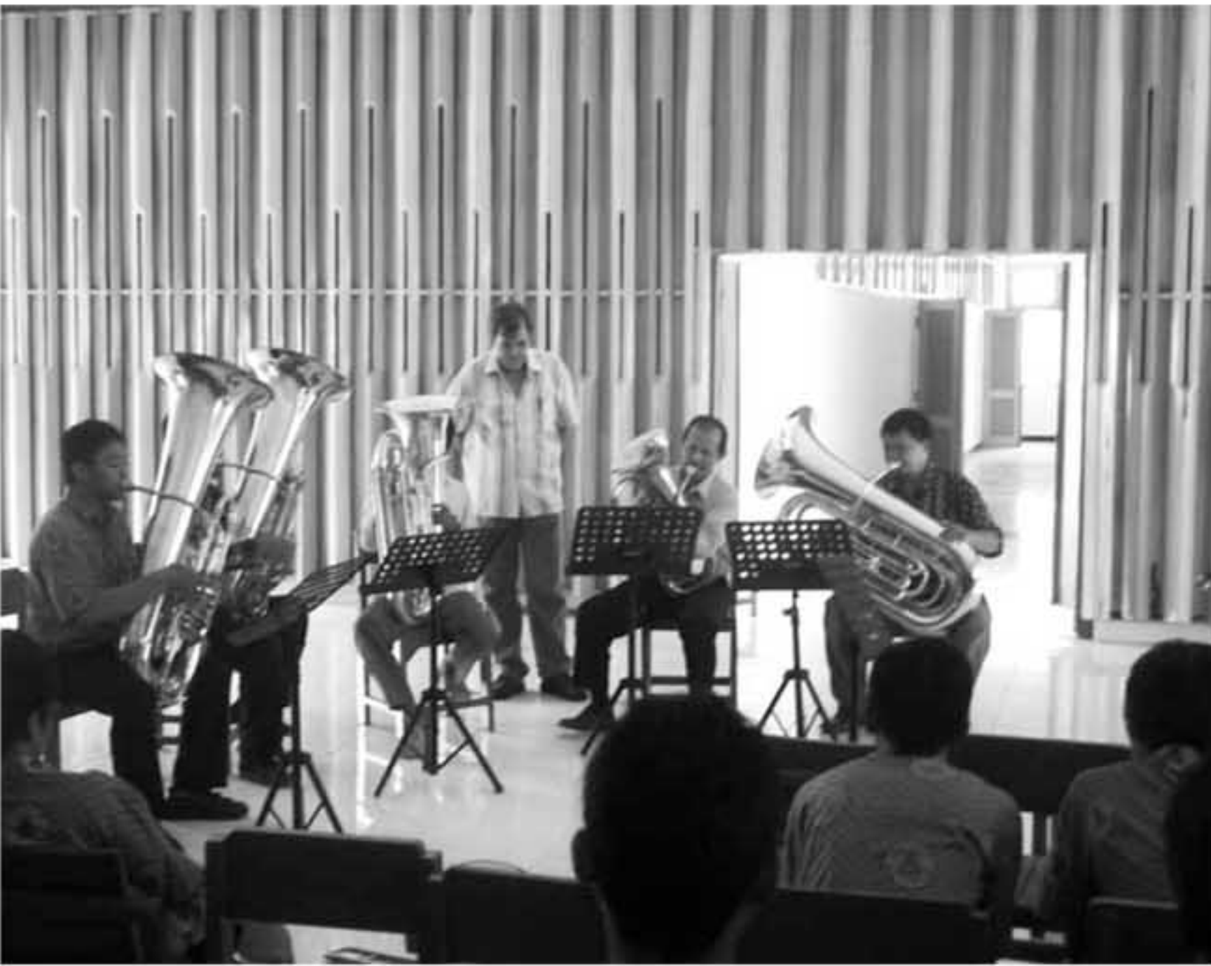
Suasana workshop tuba dan musik folk di SMM, Sabtu (6/11).

Berbeda dengan sekolah musik di luar negeri yang dikembangkan dengan serius, lanjut dia, di Indonesia kurang diperhatikan. “Kami berharap punya kesempatan mengembangkan diri melalui pertunjukan di berbagai bidang agar memberi pengalaman sebanyak-banyaknya,” harap Turino.